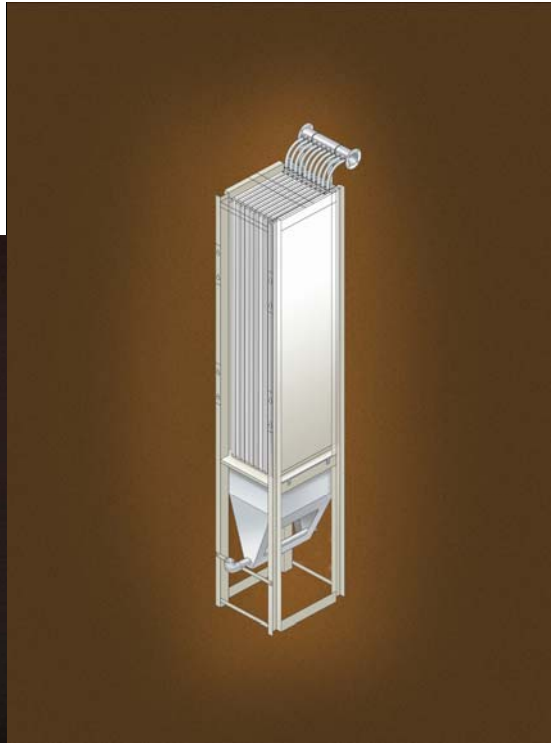
図3 セラミック平膜ユニット 外観