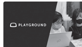
第2図 Shinonomeとの共創プロジェクト