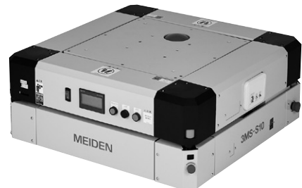
第1図 小型リフトアップAGV (3MS-S10)

駆動・操舵は二輪速度差方式とし、直進・カーブ・スピントーン走行にも対応できる。停止精度は±10mmと高く、位置ずれによる搬送エラーを低減することで、安定した搬送品質を確保している。