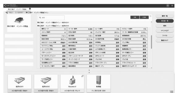
第3図 MEIDEN CONNECTの画面