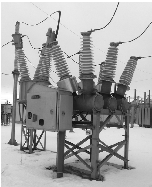
第3図 受電用遮断器

受電用遮断器の外観を示す。72kVエコ・タンク形VCBで脱SF 6 化を図っている。