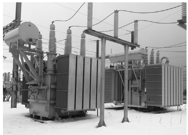
第5図 き電用変圧器

き電用変圧器の外観を示す。予備回線は五稜郭から新函館北斗間をき電し、片送りのため不等辺スコット変圧器を納入した。