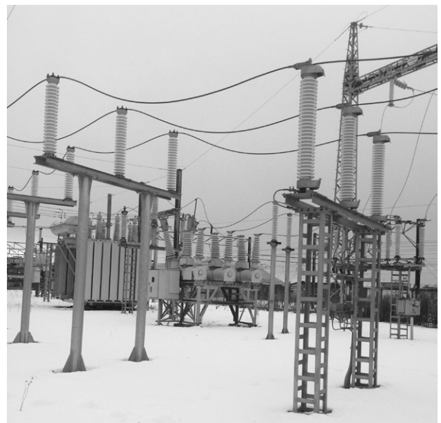
第4図 受電用避雷器

き電用変圧器は一般的に三相／二相変換を行うスコット変圧器が用いられるが、五稜郭変電所に納入した予備回線のき電用変圧器は五稜郭・新函館北斗間にき電をするため、三相／一相変換を行う不等辺スコット変圧器とした。第5図にき電用変圧器を示す。機器の主な仕様は、以下のとおりである。