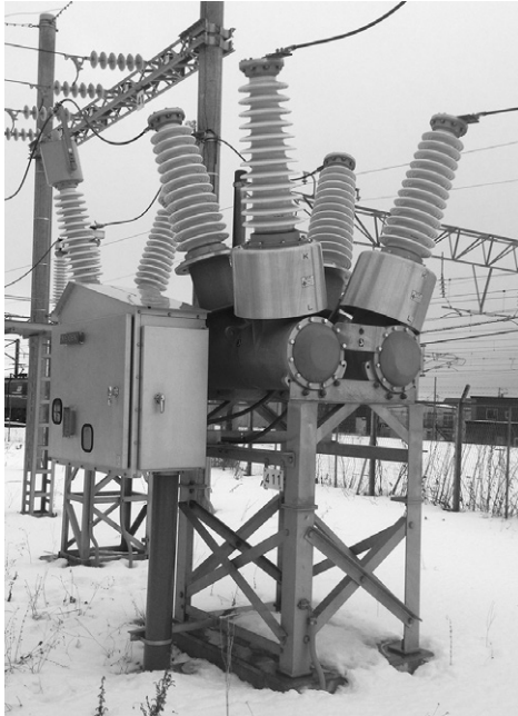
第 6 図 き電用遮断器

き電用遮断器の外観を示す。72kV エコ・タンク形 VCB で脱 SF 6 化を図っている。