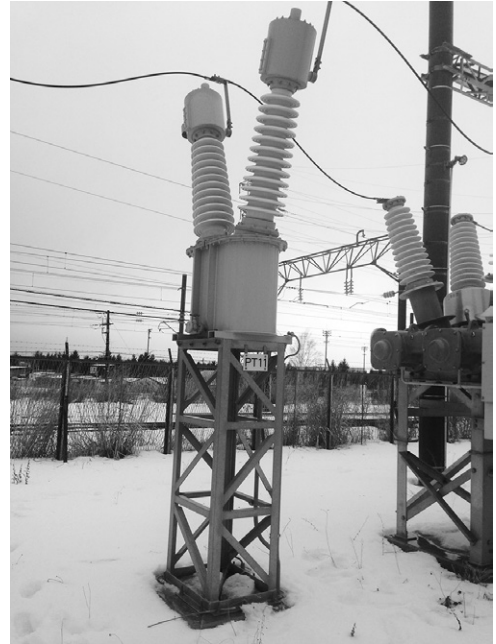
第 7 図 計器用変圧器