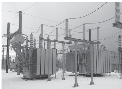
五稜郭変電所全景

五稜郭変電所は北海道旅客鉄道(株)所有の函館線の変電所で、函館線は函館駅から長万部駅・小樽駅・札幌駅を經由し、終点の旭川駅を結ぶ約420kmの路線である。北海道新幹線の開業に合わせ、五稜郭駅から新函館北斗駅間の利便性を向上するため電化工事を行った。