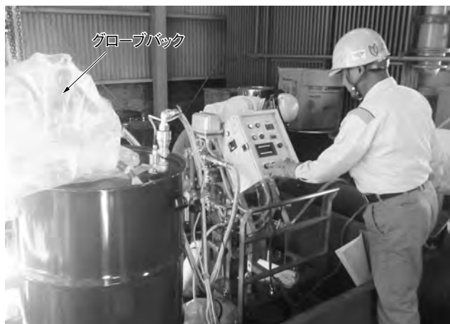
第2図 抜油作業 JESCO指定の抜油装置及びグローブバックを使用している。