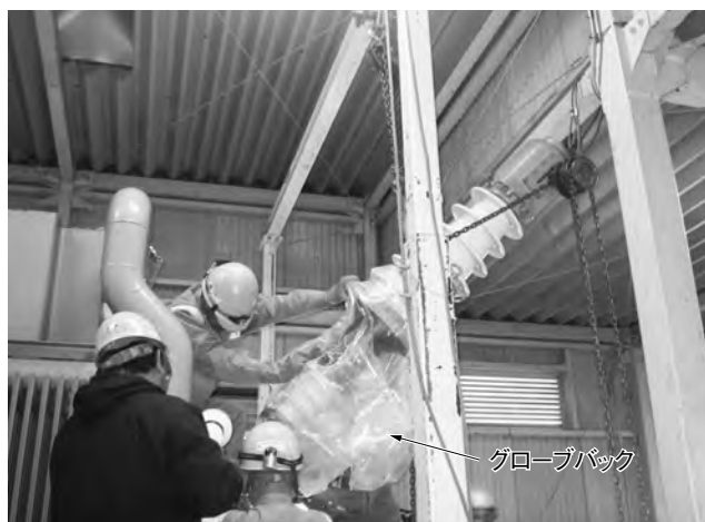
第3図 部品取り外し作業（ブッシング） JESCO指定のグローブバックを使用している。