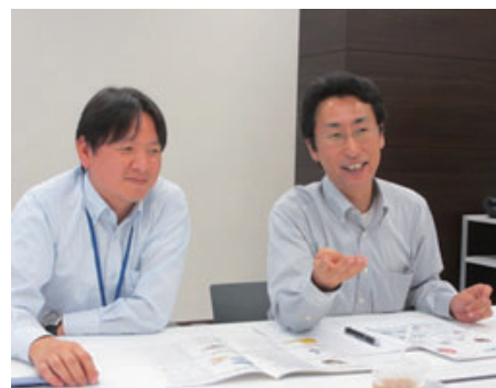
▲「近い将来、ロボットのようなAGVが生まれるかも？」

森 運ぶって、ムダなこと。私はそう考えています。部品を運んでも、組み立てなければ商品は生まれないし、食材をスーパーから家に運んできて、料理しなかったらただの食材のまま。運ぶことは、何も生み出さないんです。もし、全人類が運ぶことをAGVに任せることができたなら、人は作ることに集中できる。人にしかできないことがあるからこそ、AGVは人のような「運ぶ」ができるようにならなくてはいけない。いや、「人」以上ですかね。もしかしたら近い未来、漫画に出てくるロボットのようなAGVが生まれるかもしれませんよ。