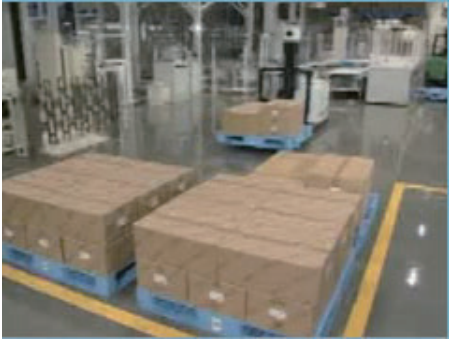
▲レーザー誘導のデモンストレーション

森 ルート通りに走行するために必要となってくるのが、フィードバック制御です。みなさんは、1ミリのズレも無くまっすぐ歩くことができますか？きっとできる人なんていないですよ。ほんのわずかだけ、フラフラと左右に蛇行しながら歩いているはず。周りのものとの距離感を測ったりすることで、常に自分の位置を修正しながら進む。これがフィードバック制御なんです。AGVもみなさんと同じようにフラフラと走っているんですよ。常に自分の位置を読み取りながら、正確な位置へとスムーズに修正しながら走っています。