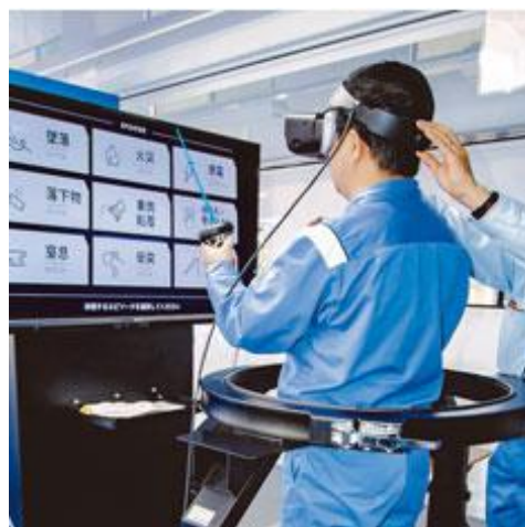
3軸シミュレータ（注記）を利用したVR安全体感教育の様子

昨今、新型コロナウイルス感染症の拡大の影響により集合教育の実施が難しくなる中、お客様からのご要望にお応えをし、お客様ご自身で柔軟に教育を実施できる本サービスを開始いたしました。契約者は月額定額で、当社が専用サイトにて販売している、墜落・火災・感電・転倒など全9種類のVR安全体感教育コンテンツを自由にダウンロードし使用することができるほか、今後開発される新作コンテンツについても、リリースされ次第、利用可能となります。