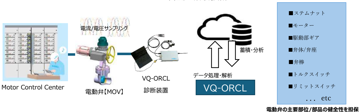
VQ-ORCL の計測・解析技術