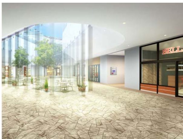
<ThinkPark Plaza イメージパース>

店 舗 数：25 店舗(7/23 現在) 総 店 舗 面 積：約 4,100 m 2