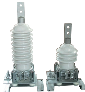
(ZS-C1 28kV 8.4kV)

定格電圧 : 4.2 ~ 42kV 公称放電電流 : 10kA 放電耐量 雷 Imp.(4/10 \mu s)… 65kA×2回 方形波(2ms)… 400A×20回 耐汚損区分(耐汚損形) 0.03、0.06、0.12、0.35mg/cm 2