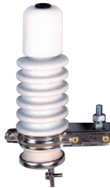
(ZS-CMX 8.4kV 0.06mg/cm 2 )

定格電圧 : 4.2、8.4、14kV 公称放電電流 : 5kA 放電耐量 雷 Imp.(4/10 \mu s)… 20kA×2回 方形波(2ms)… 150A×20回 耐汚損区分… 0.06、0.35mg/cm 2